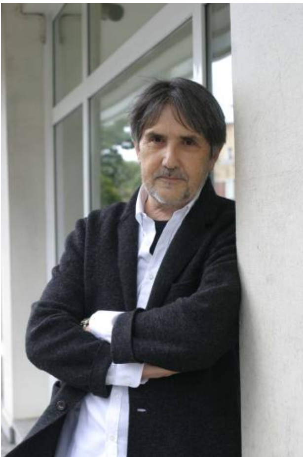
Ramón Saizarbitoria, en una imagen de archivo.

El sentimiento de culpa es una constante en La educación de Lili , la última novela de Ramón Saizarbitoria (San Sebastián, 1944), una traducción de la versión en euskera que publicó hace un año con el título Lili eta biok (Lili y los dos). El autor indaga en esta obra en la culpa "por pertenecer al género masculino" y en la culpa, también, "por lo que hicieron nuestros antepasados".